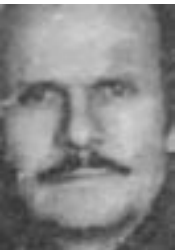
του Θ. Ν. Σαρβελά

Πλησιάζει το καλοκαίρι, με τις θερμοκρασίες που καίνε την Πατρίδα μας, σχεδόν κάθε χρόνο. Τα λιγοστά πια δάση μας εξαφανίζονται, μέσα σε μια κόλαση πυρός. Αφανίζονται τα ρητινοφόρα πεύκα μας, με τους θάμνους κι όλη τη χλωρίδα και μαζί τα λιγοστά πια ζώα της άγριας πανίδας. Χάνονται κοπάδια από ημέρα ζώα, αλλά και πόλεις και χωριά και άνθρωποι, δυστυχώς!