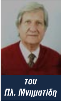
ΤΟΥ Πλ. Μνηματίδη

Επαγγελματικό ταξίδι στο Hong Kong: Το πρακτορείο μάς είχε κλείσει δωμάτια στο ξενοδοχείο Peninsula. Γνωστότατο ξενοδοχείο, παγκοσμίως, γιατί σε αυτό κατέλυαν όλες οι προσωπικότητες: μέλη βασιλικών οικογενειών, πρόεδροι δημοκρατιών, πρωθυπουργοί, υπουργοί, γνωστοί επιχειρηματίες κ.λπ.