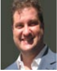
του Π. Μινηματίδης